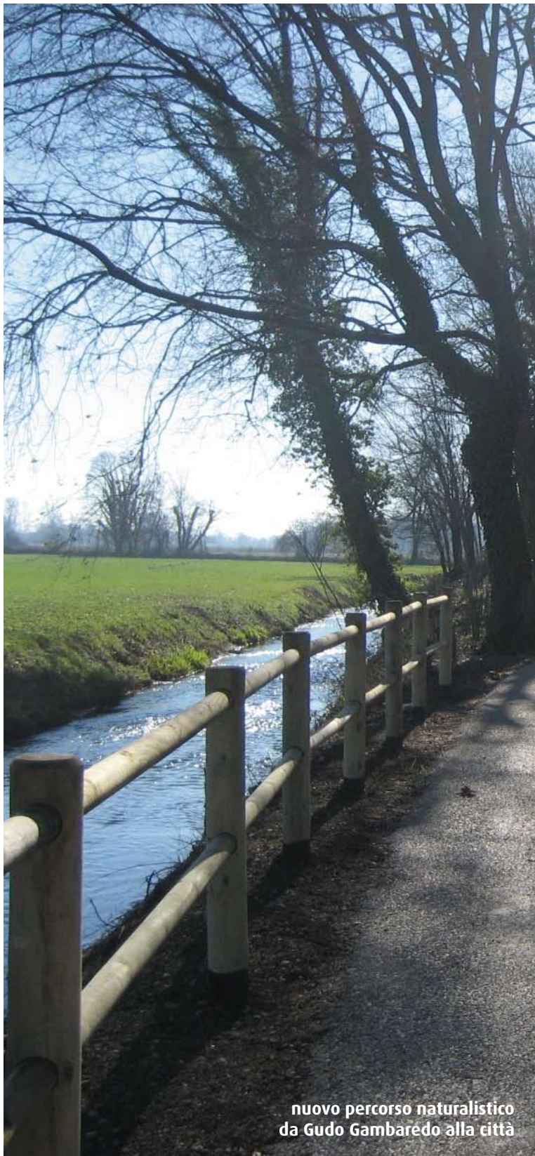
nuovo percorso naturalistico da Gudo Gambaredo alla città

Come editoriale di maggio vorrei dedicare a tutti voi, cittadini di Buccinasco, una poesia. Questa poesia delicata e bella rappresenta una spiegazione della vita ed è contenuta in una musica singolare e continua.